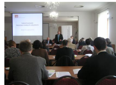
Foto: valná hromada 2013